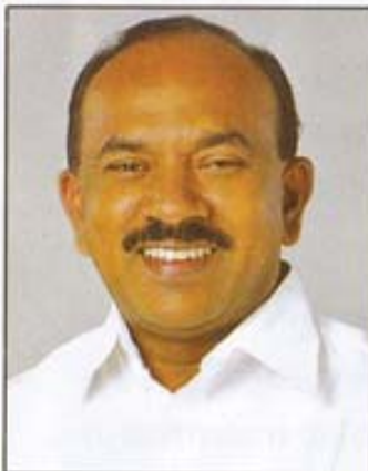
ശ്രീ. പി. തിലോത്തമൻ (ബഹു. ദക്ഷ്യ വകുപ്പ് മന്ത്രി)