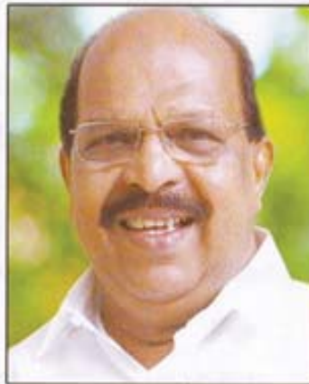
ശ്രീ. ജി. സുധാകരൻ (ബഹു. പൊതുമരാമത്ത് വകുപ്പ് മന്ത്രി)

അഡ്മിനിസ്ട്രേഷൻ വിഭാഗത്തിന്റെയും വിദ്യാർത്ഥി സേവന സംരംഭങ്ങളുടെയും ഉദ്ഘാടനം